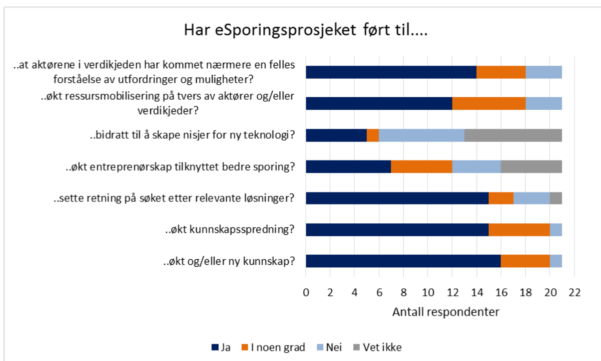
Figur 3-2: Effekter av eSporingsprosjektet. Oppsummering fra intervjuene. 21 respondenter har svart på alle spørsmålene.

Det er ikke derimot sagt at man ikke ville sett lignende effekter også uten eSporingsprosjektet. Flere av aktørene i de ulike bransjene var allerede i gang med utvikling av egne sporingsløsninger da prosjektet startet opp. Det er heller ikke urimelig å tro at hendelser som E.coli saken i 2006 eller generell utvikling i markedet, ville fått bransjen til å reagere på egenhånd. I intervjuene har vi derfor spurt hvorvidt respondentene mener nevnte effekter er et resultat av eSporingsprosjektet eller ikke. En oppsummering av svarene er gitt i figuren under.