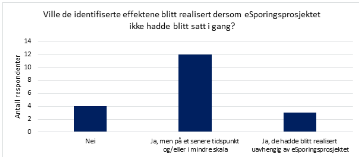
Figur 3-3: eSporingsprosjektets addisjonalt tilknyttet de oppgitte effektene. 19 av intervjuobjektene har svart på dette spørsmålet.

Som figuren viser er det stor enighet om at man ville ha sett lignende effekter selv om eSporingsprosjektet ikke hadde blitt gjennomført. Flere av intervjuobjektene påpeker imidlertid at prosjektet fungerte som et «spark bak» for å sette i gang prosesser, og at uten eSporingsprosjektet ville oppnådde resultater trolig kommet på et senere tidspunkt.